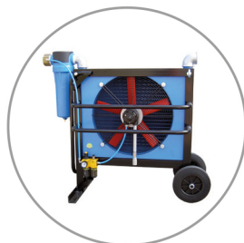
COMPRESSED AIR AFTERCOOLERS