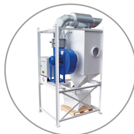
MOBILE DUST EXTRACTION UNITS