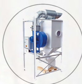
MOBILE DUST EXTRACTION UNITS