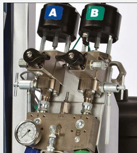
Collettore di miscelazione standard

È possibile scegliere tra un collettore di miscelazione su telaio o un collettore remoto; entrambi sono dotati di manometro che visualizza la pressione d'uscita del fluido.