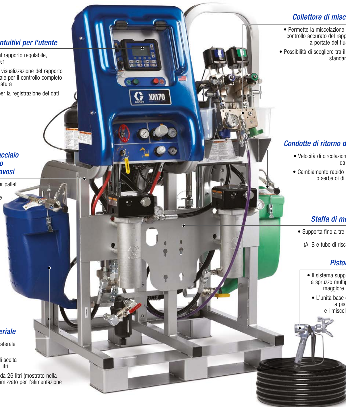
Spruzzatore multicomponente Graco XM (modello base con serbatoi da 26 litri)*