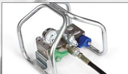
Collettore di miscelazione remoto

La miscelazione del materiale raggiunge un nuovo livello di precisione grazie a una tecnologia di dosaggio innovativa. Con Graco XM, il componente minore (o materiale lato B) viene iniettato ad alta pressione nel materiale maggiore (lato A). Sensori avanzati consentono alle pompe di compensare le fluttuazioni della pressione, generando una miscelazione accurata e con il rapporto giusto per una resa migliore e una riduzione degli sprechi.